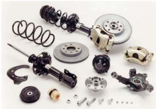
Componentes a montar