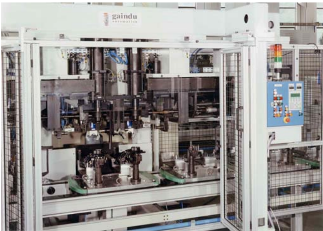
Atornillado porta manguetas amortiguador