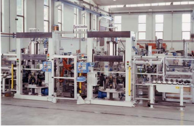
Estaciones montaje columna suspensión