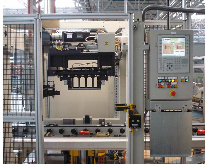
Medición Altura cigüeñal