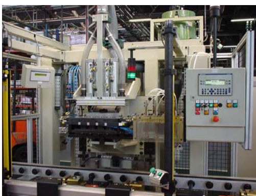
Inserción pistones en bloque motor