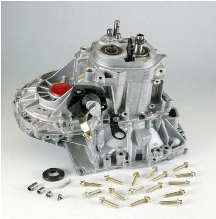
Caja de cambios. Incluye caja diferencial