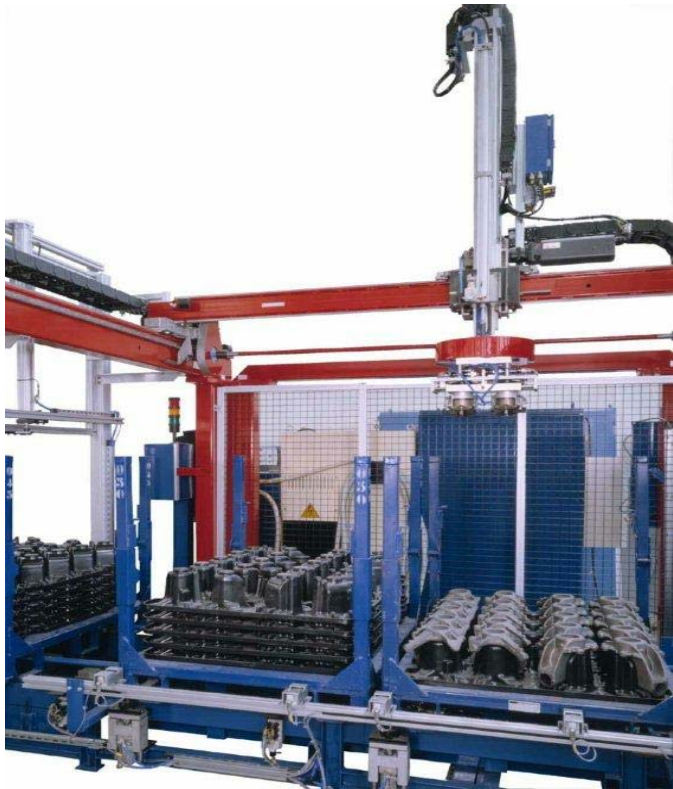
Pórtico despaletizado portamanguetas