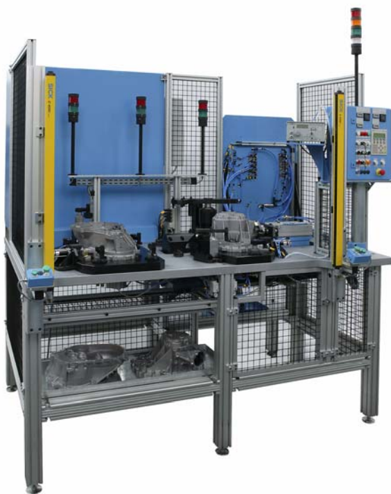
Vista general de la máquina